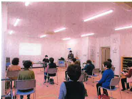
▲真剣に話を聞く参加者