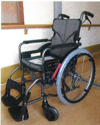
▶ 思いやり型返礼品 「前橋市内の施設への車いすの寄贈」